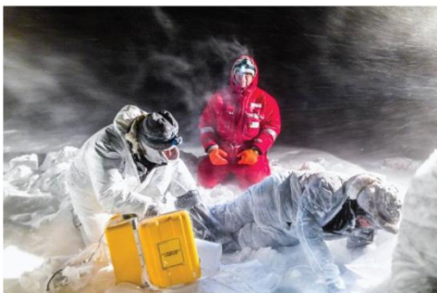
22. La récolte d'échantillons se fait parfois dans des conditions difficiles.