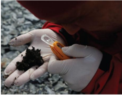
13. Un scientifique à la recherche des indices les plus infimes.