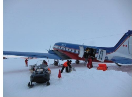
3. Déchargement d'un avion.