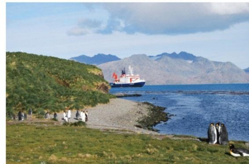
9. L'équipage du Polarstern rend visite aux manchots de l'Antarctique.