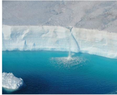
14. Chute d'eau à la limite de la plateforme de glace qui s'écoule du continent vers l'océan.