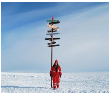
10. Les directions et distances entre la base allemande Neumayer située sur le continent antarctique et le reste du monde.