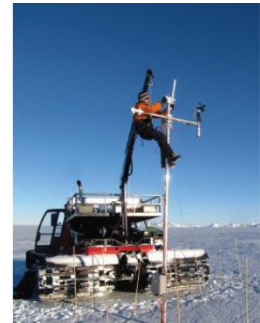
21. Installation d'une station météorologique.