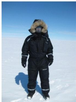
7. Scientifique très bien équipé.