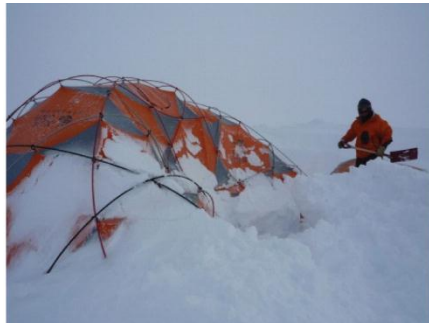
19. Un scientifique creuse pour dégager sa tente enneigée après une tempête.