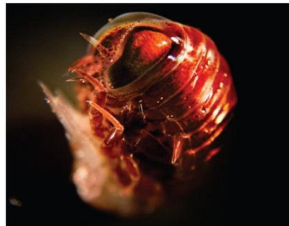
8. Animal mystérieux de l'infiniment petit.