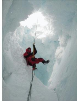
2. Les crevasses peuvent être dangereuses. Il vaut mieux pouvoir en sortir.