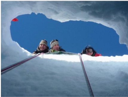
16. Mais qu'y'a-t-il dans ce trou?