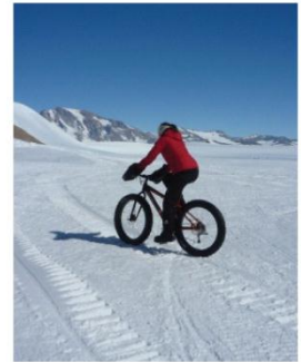
18. Une scientifique découvre les joies du VTT sur les plaines gelées de l'Antarctique.