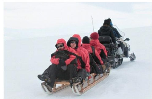
12. Ces scientifiques sont acheminés vers le sommet d'un glacier en Antarctique.