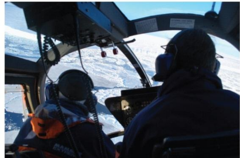
6. Ces scientifiques vont être déposés par un hélicoptère à la station Neumayer.