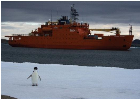
4. Aurora Australis et manchot Adélie à la base Mawson.