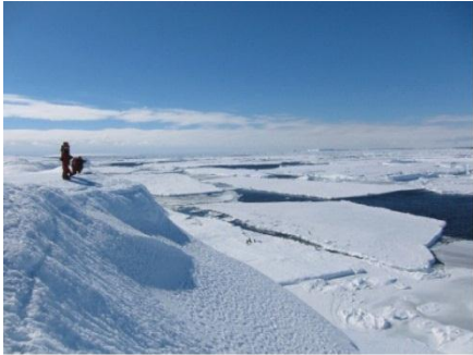
1. Les scientifiques observent une petite colonie de manchots Adélie.