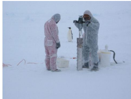
20. Les scientifiques prennent une carotte de glace.