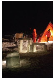
5. Poste de plongée, RV Polarstern.